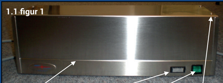
1.1 figur 1